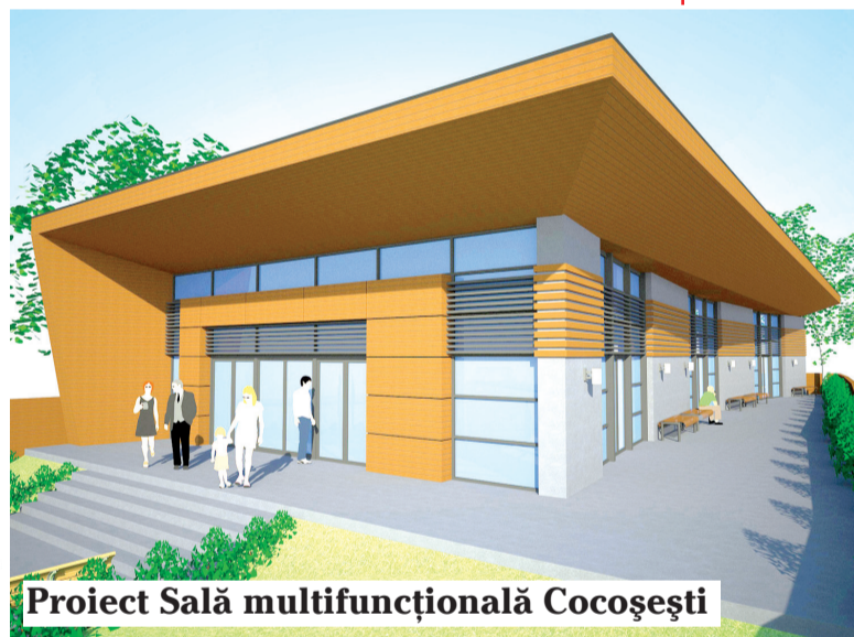
Proiect Sală multifuncțională Cocoșești